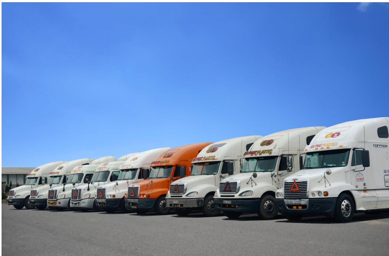
(Đội xe container vận chuyển của Nhà máy 6)