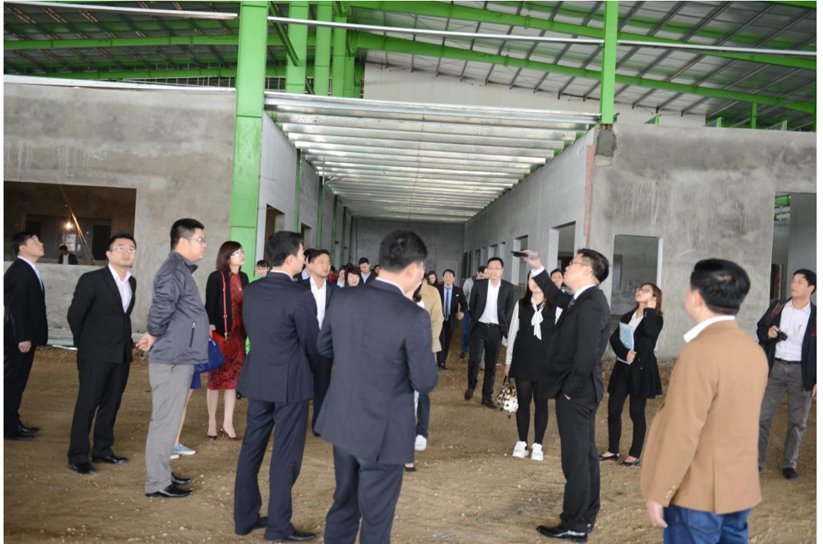
(Cổ đông thăm quan dự án Nhà máy 6 sau khi Đại hội kết thúc)