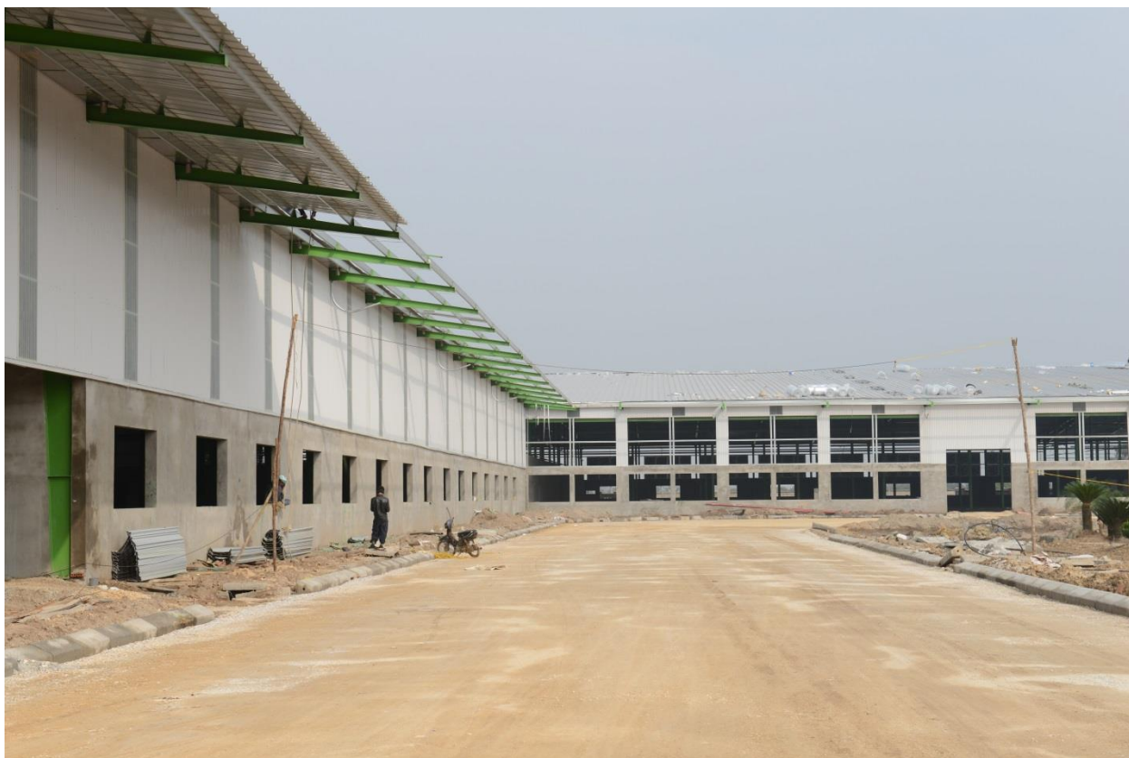
(Hạng mục thi công đường nội bộ Nhà máy 6)