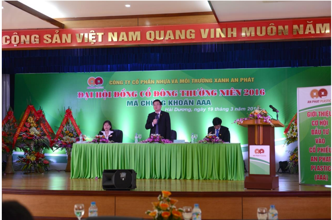
(Đoàn chủ tịch Đại hội)

Dưới đây là một số hình ảnh của phiên họp Đại hội đồng cổ đông 2016