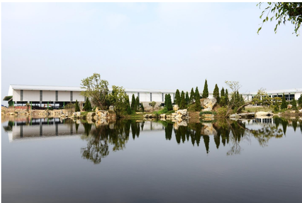
(Nhà máy 6 nhìn từ hồ điều hòa của Công ty)